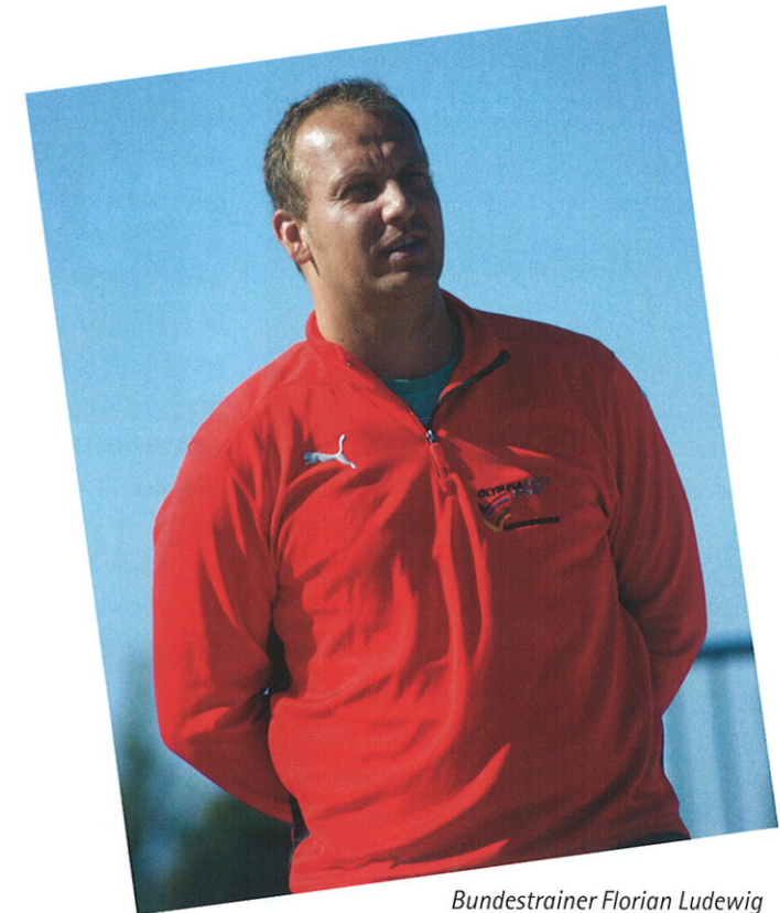
Bundestrainer Florian Ludewig

verhalten sind wichtig, keine andere Sportart ist so komplex. Alles andere guckt man sich besser selber an, dann wird man verstehen, warum einen das BMX-Fieber nicht mehr loslässt.“